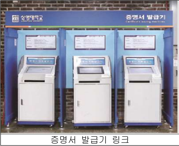
증명서 발급기 링크